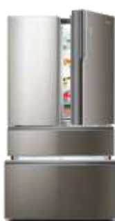
卡萨帝朗度多门冰箱