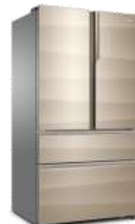
卡萨帝朗度多门冰箱