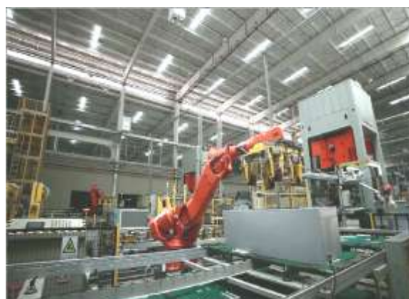
图为：沈阳冰箱智能化 U 壳配送线体