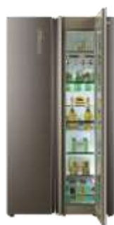
Smart Window 智慧窗冰箱